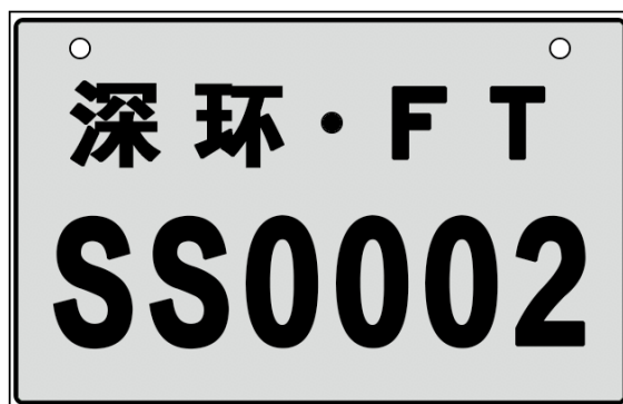
图 6.2 号牌示意图

示例：福田区、车牌顺序号为 0002、纯扫式扫路机，标记为：FTSS0002。对应的车牌号如下：